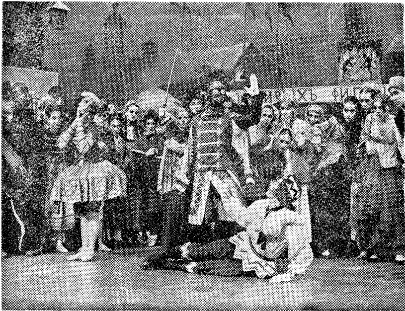
«Petruschka», una de las grandes creaciones del Ballet Nacional de Holanda

Es uno de los mejores conjuntos del mundo y actuará en Barcelona mañana y pasado mañana